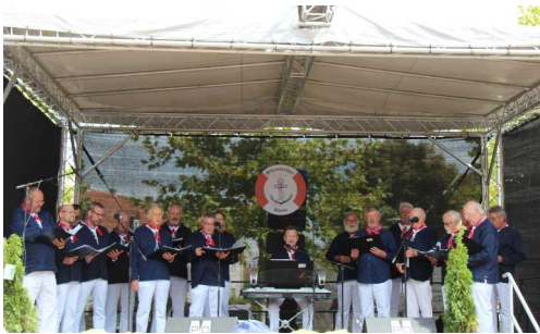
Auftritt Shantychor Rheine

Ein Fest-Nachtreffen hat ergeben, dass das Fest alle zwei Jahre stattfinden soll (gerade Jahreszahlen) und das auch wenn es keine Förderung mehr über die Soziale Stadt gibt. Es gab bereits erste Finanzierungsideen.