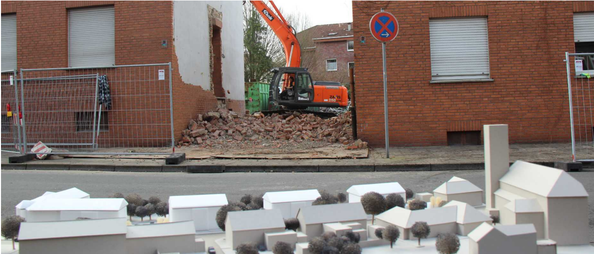
Bauvorhaben Darbrookstraße, Quelle: E. Vogel