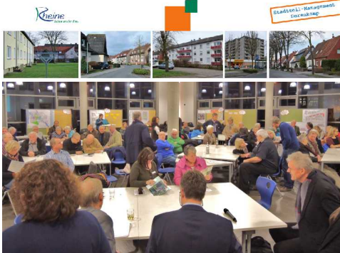
Ausschnitt Einladung, Forum

Kommen Sie, informieren Sie sich und reden Sie mit!