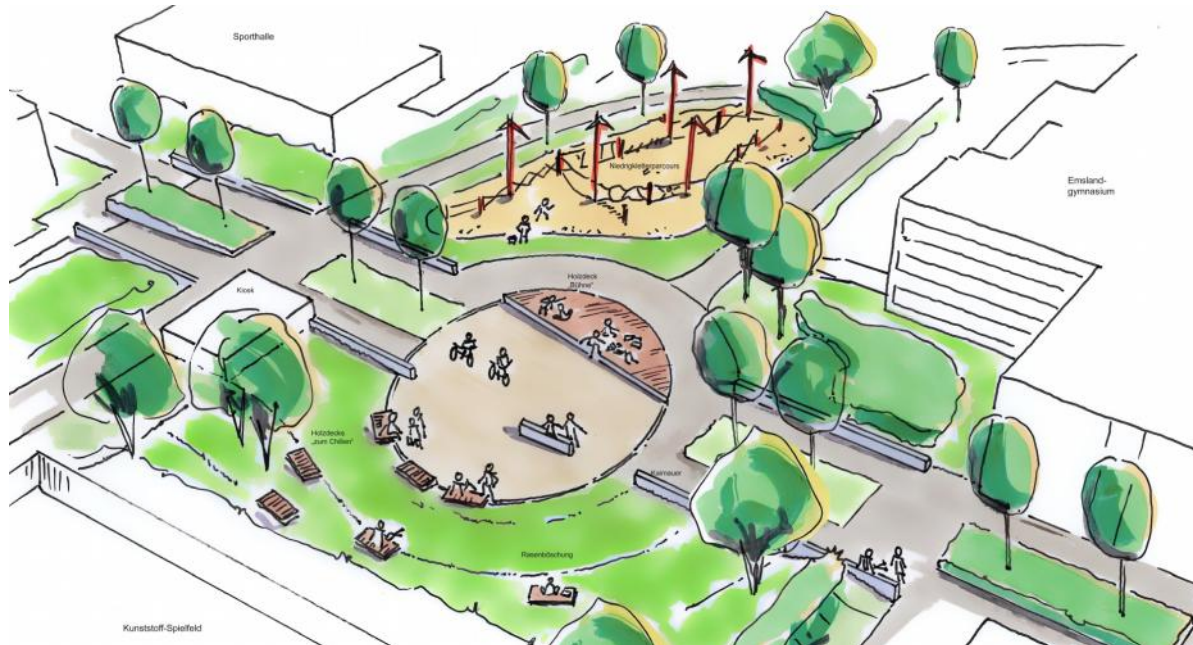
Detailplanung Zentrum Kaimauern mit Schleusenplatz